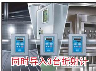
同时导入3台折射计