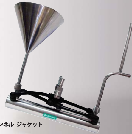
ファンネル ジャケット