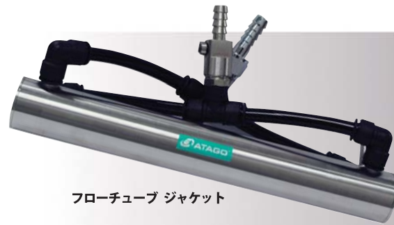
フローチューブ ジャケット