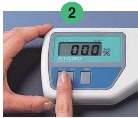
2 スタート/オフスイッチを押します。