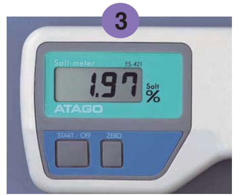
3 矢印が3回点滅した後、サンプルの塩分%を表示します。

※食塩以外の成分が含まれているサンプルでは、Brix(ブリックス・可溶性固形分)6%以下になるように希釈して測定してください。 例えば、醤油・ソースでは、蒸留水で10倍(重量比)に希釈して測定し、その表示値を10倍すると、もとの醤油・ソースの塩分%が求まります。