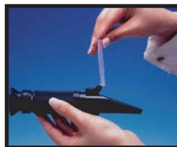
①採光板を開けてください。