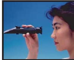
③接眼鏡をのぞいて目盛を読んでください。