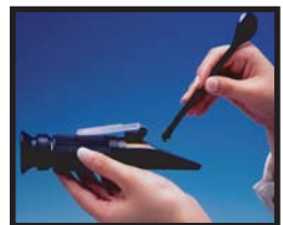
②サンプルを1~2滴、プリズム面に滴下してください。