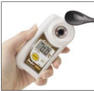
サンプルをプリズムに滴下。