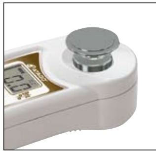
MAGIC(下記参照)をかぶせる。