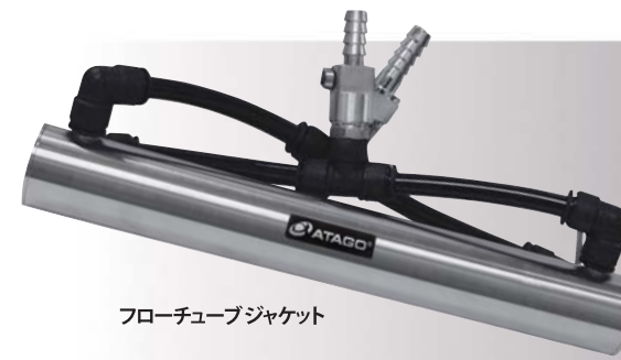
フローチューブジャケット