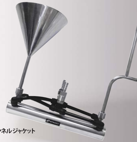
ファンネルジャケット