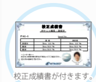
校正成績書が付きます。