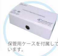
保管用ケースを付属しています。