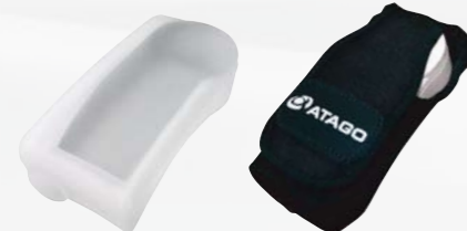
▲PAL用シリコンカバー ▲PALケース

◀MAGIC™ ※高温サンプルまたは揮発性があるサンプルの測定時にご使用ください。